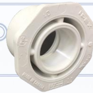
80030654 CASQUILLO ADAPTADOR 1.5" A 1" (TUBO 3/4"), SPIG X SOC, PVC SCH 40, 1"