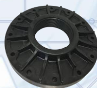
50040149 6" TAPA DE CIERRE CON ROSCADE 4" *