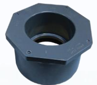
80030953 CASQUILLO ADAPTABLE PARA TUBO DE 3" A 2" SPIG X SOC PVC SCH 80