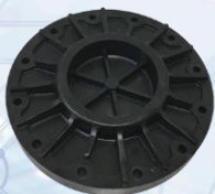
50040148 TAPA DE CIERRE DE 6" *